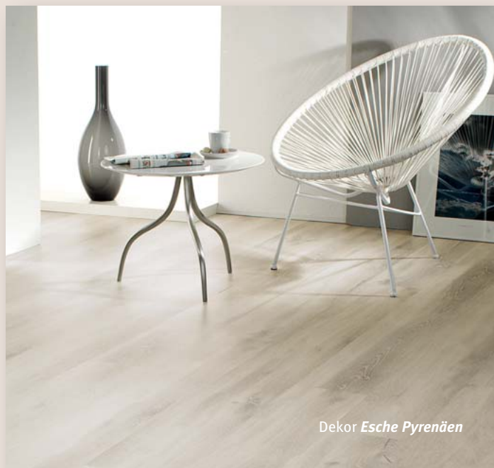
Dekor Esche Pyrenäen

Eine besonders edle Optik entsteht durch die Verlegung der neuen 180 cm langen Dielen. In großen Räumen sind sie eine Augenweide.