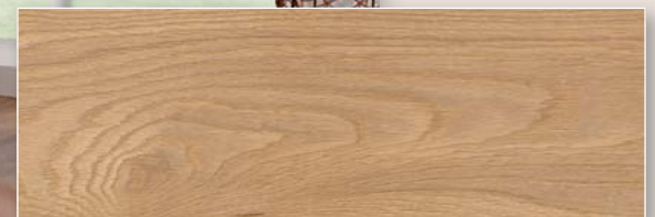
Eiche de Luxe