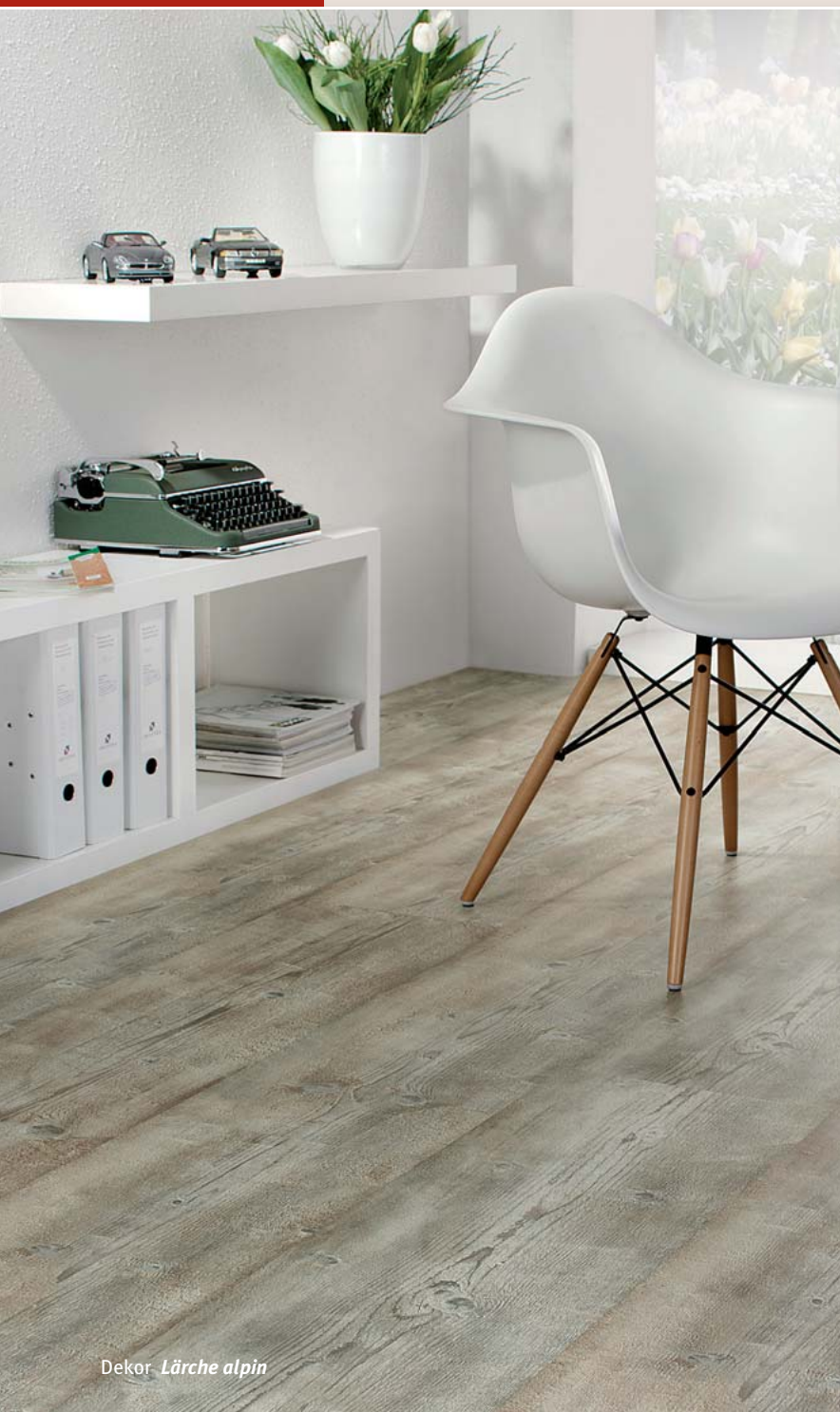
Dekor Lärche alpin

Dielenformat: 1.235 x 305 mm mit Supermikrofase