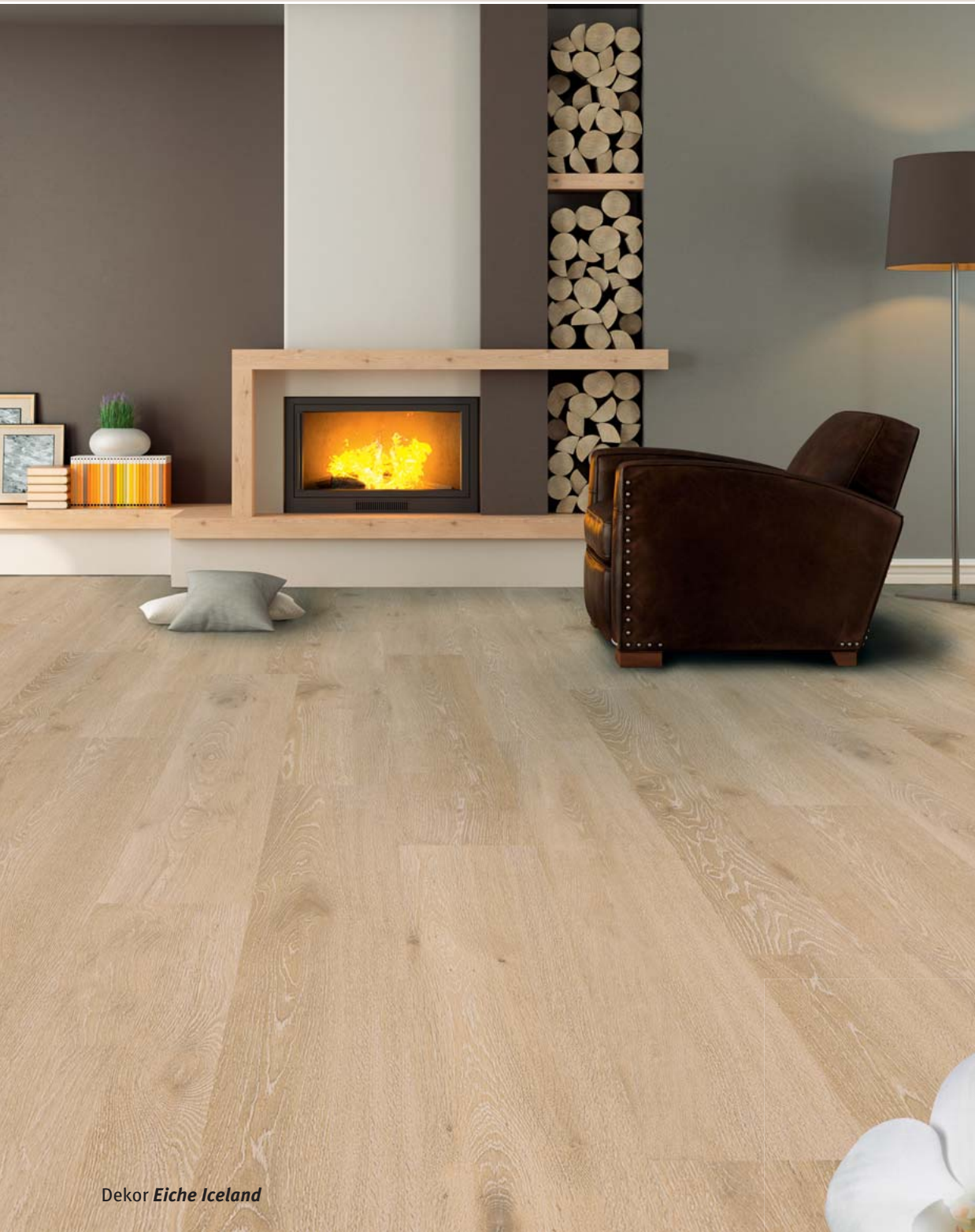
Dekor Eiche Island