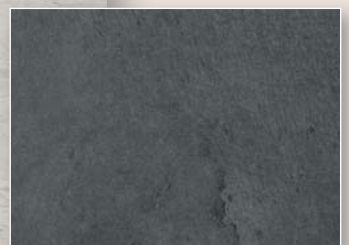
Cement dark grey