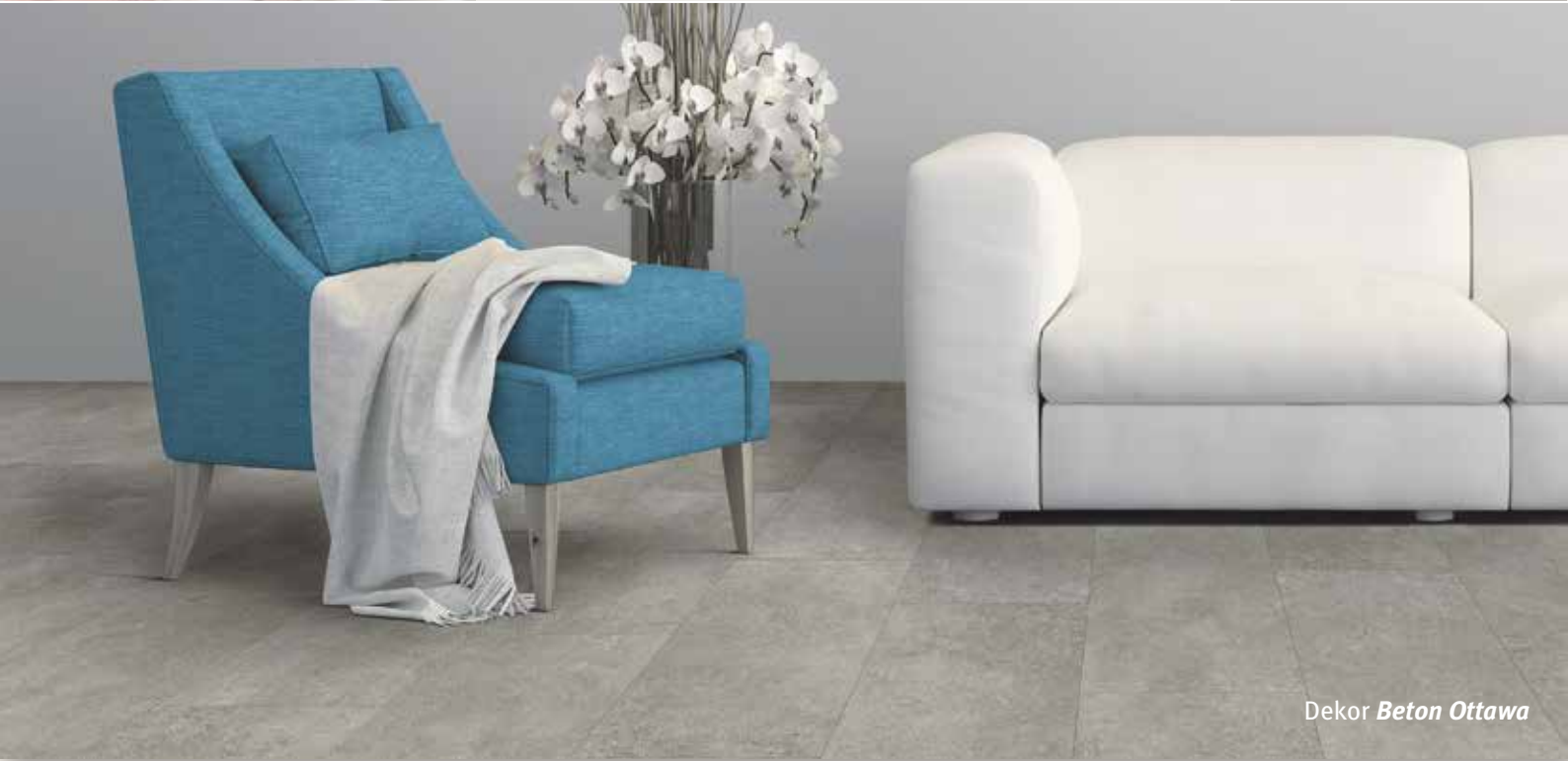
Dekor Beton Ottawa