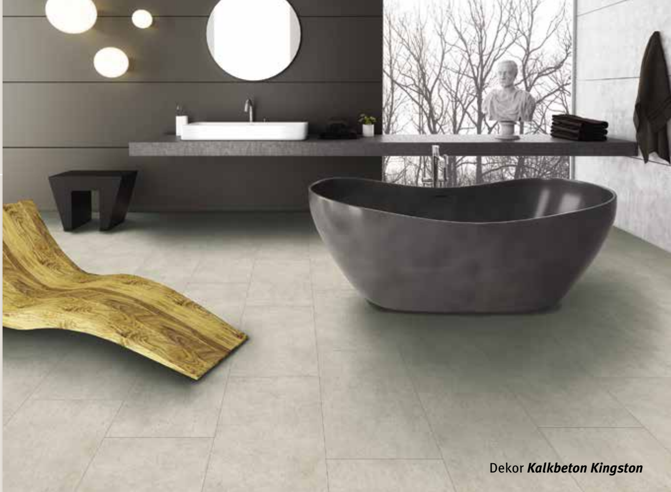
Dekor Kalkbeton Kingston