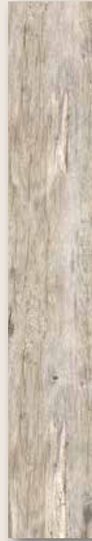
Antikholz Las Vegas