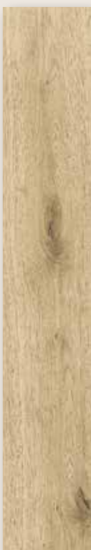
Eiche San Diego