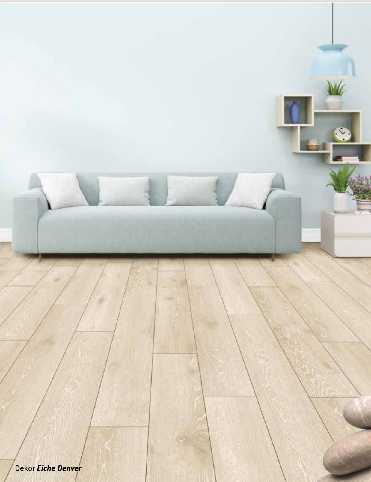
Dekor Eiche Denver